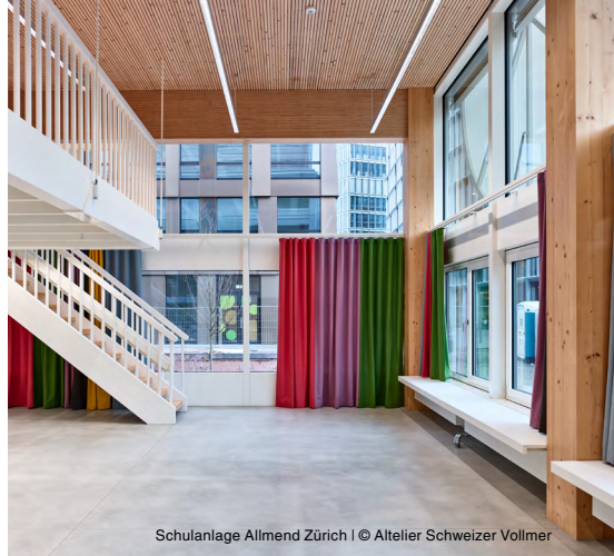
Schulanlage Allmend Zürich | © Atelier Schweizer Vollmer