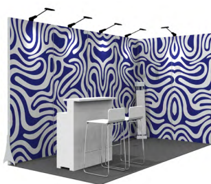
Grafik-Option 2 Vollflächig auf allen Fronten