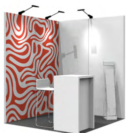
Grafik-Option 1 Vollflächig auf einer Front