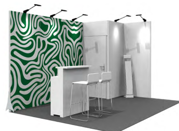
Grafik-Option 1 Vollflächig auf einer Front