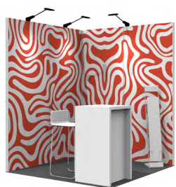
Grafik-Option 2 Vollflächig auf allen Fronten