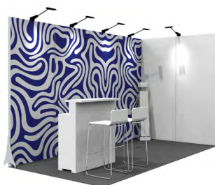
Grafik-Option 1 Vollflächig auf einer Front