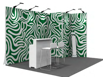
Grafik-Option 2 Vollflächig auf allen Fronten